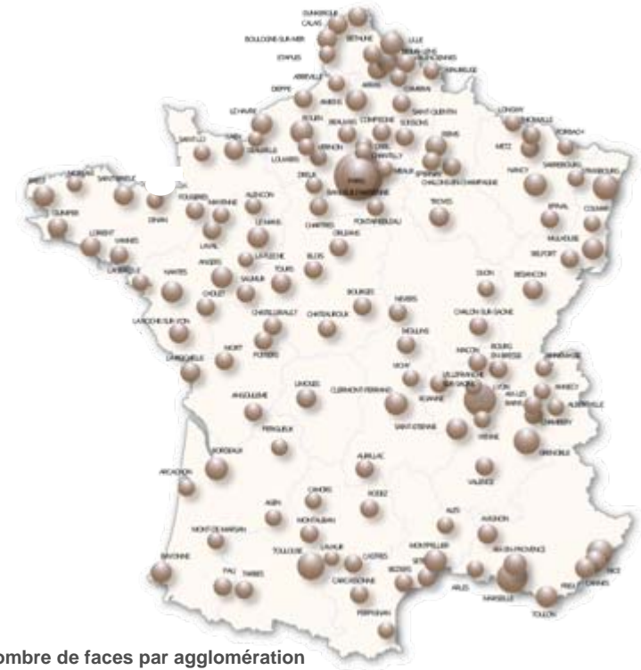
Nombre de faces par agglomération

Paris : 1 310 faces Banlieue : 3 152 faces Province : 10 388 faces