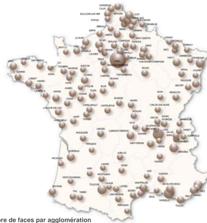
Nombre de faces par agglomération

Paris : 1 310 faces Banlieue : 3 152 faces Province : 10 388 faces