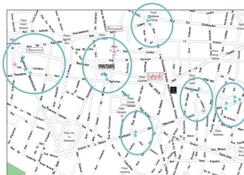
Paris– 440 faces ciblées sur les Pôles de vie des femmes CSP+ Zoom sur le 9 ème arrondissement