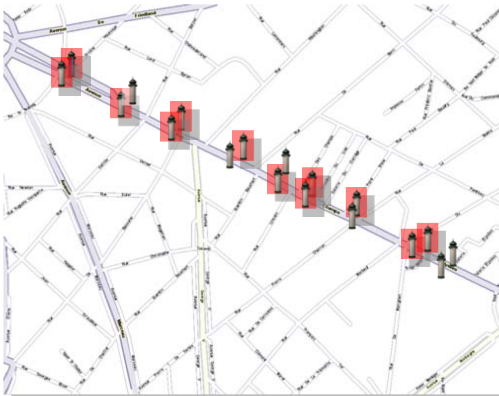
Paris - 12 hauteurs